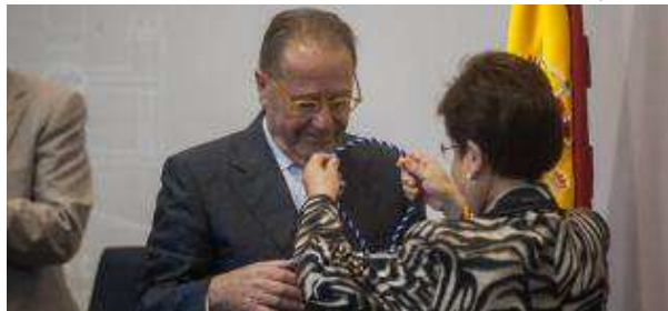
Santiago reivindica la necesidad de los trasvases tras ser nombrado «Alicantino de Adopción»