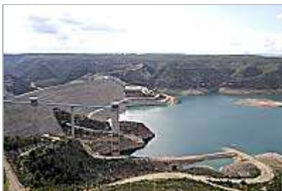
Aspecto del pantano de Tous con un bajo nivel de agua embalsada.

Al término del encuentro, Francisco Pons explicó el alcance del acuerdo logrado. Señaló que entre el Círculo y AVE se financiará un estudio realizado por científicos y técnicos de las dos autonomías, con el que se tratará de ver cuál es el problema