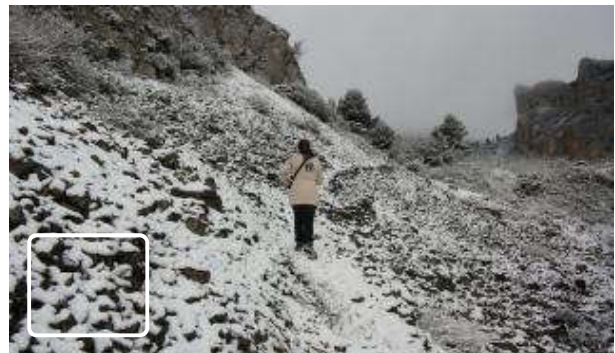
Climatología prevé que la ola de frío lleve la nieve hoy hasta el nivel del mar en la provincia

La nieve llegó ayer a muchos puntos del interior aunque de forma débil, provocando una caída de las temperaturas que se esperaba fuera brusca la pasada madrugada. La precipitación se dejó notar en las sierras de Aitana, la Serrella, el Montcabrer e incluso el Puig Campana, y a media tarde con cierta intensidad en los cascos urbanos de Alcoy, Cocentaina, Muro y los pueblos situados en las partes más altas de l'Alcoià, El Comtat y las Marinas, llegando a cuajar en tejados, vehículos y campos cercanos. También cayó en Aspe, donde no lo hacía desde 1983, y aguanieve en Elche,