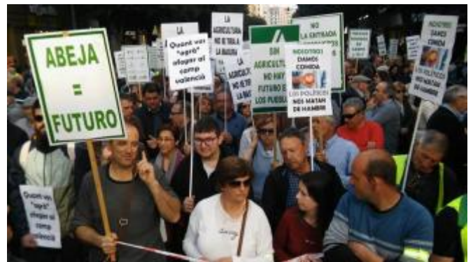
Cabecera de la manifestación, en la que participaron dirigentes alicantinos.