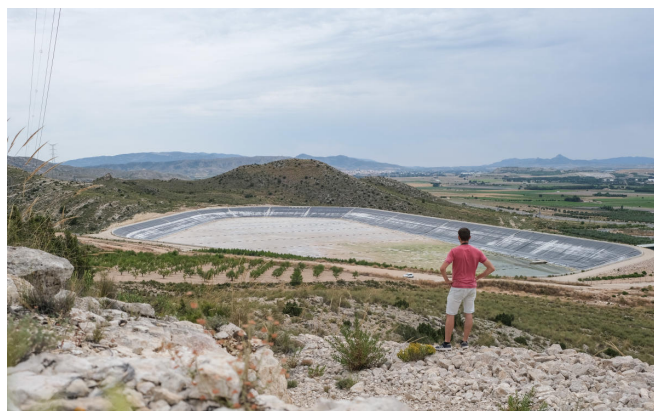
El Gobierno autoriza un trasvase del Ebro a Santander mientras niega enviar 4 hm 3 del Júcar al Vinalopó

La empresa estatal Acuamed , dependiente el Ministerio para la Transición Ecológica, ha dejado, de nuevo, este verano sin agua a los regantes de las comarcas del Vinalopó al negarles el riego de socorro de 4 hm 3 que venían solicitando desde febrero de este año el Júcar a través del trasvase, que lleva cerrado desde hace dos años y sin arrancar tras una inversión de 450 millones de euros, de los que 120 millones llegaron en forma de subvención de la Unión Europea.