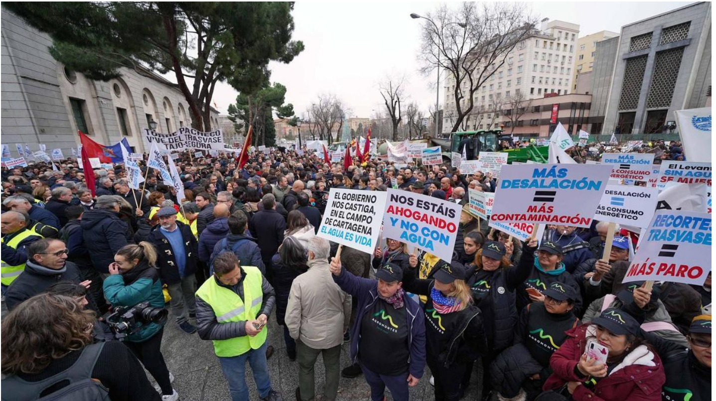
La manifestación realizada en Madrid el pasado mes de enero para exigir la retirada del recorte del Tajo-Segura.

14-04-23 | 12:25 | Actualizado a las 14:26