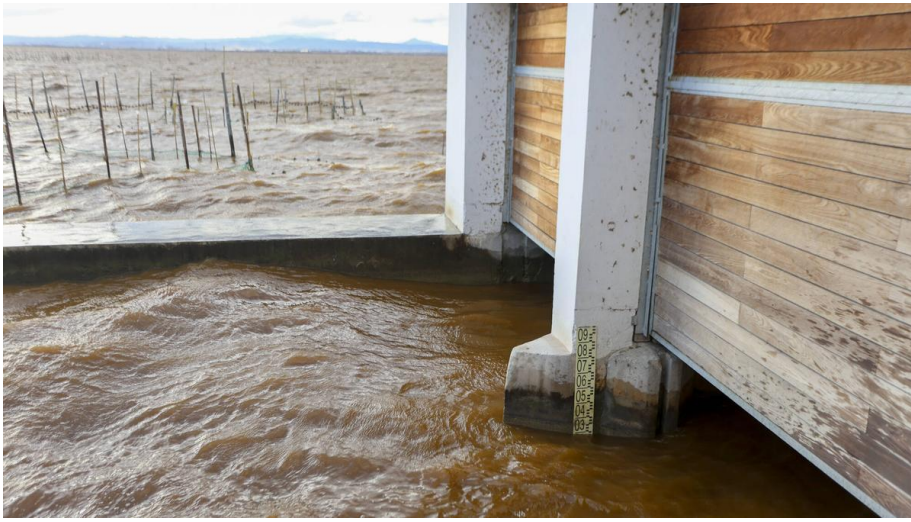
Imagen de l'Albufera estos días en la Gola del Pujol FERNANDO BUSTAMANTE