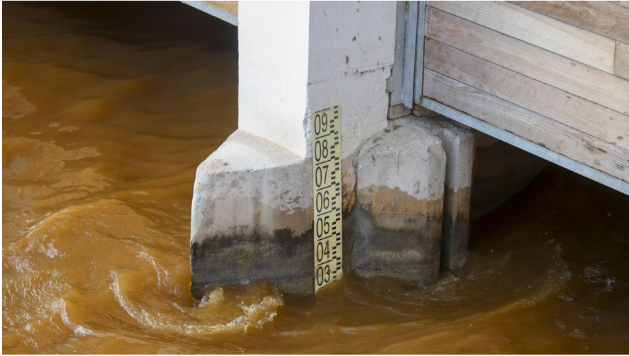
Gola del Pujol que comunica el lago con el mar FERNANDO BUSTAMANTE

se les indicaba su papel en el control de la sustracción de recursos hídricos hacia los campos. Lo cierto es que fue en 2018, en la etapa del primer Botànic, cuando desde el departamento que entonces dirigía la consellera Elena Cebrián cuando se fijaron unos niveles mínimos para l'Albufera tras varias denuncias ante la Fiscalía Provincial de València .