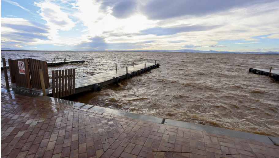
El lago de l'Albufera lleva un mes sin el nivel de agua mínimo fijado por Medio Ambiente en 2018 FERNANDO BUSTAMANTE

La Confederación Hidrográfica del Júcar no enviará agua al lago de l'Albufera al margen de lo establecido en el Plan Hidrológico 2022-2027 ni de las concesiones otorgadas a las comunidades de regantes en el ámbito del parque natural. Así lo explicitaba poco después de la reunión a tres bandas con el Ayuntamiento de València y la Conselleria de Medio Ambiente para abordar el incumplimiento de los niveles de la laguna desde hace más de un mes. Situación que avanzaba Levante-EMV en su edición del sábado. Sí hará de intermediario con la Acequia Real del Júcar, la de Favara y la de Quart "para valorar la posibilidad de aportes extraordinarios".