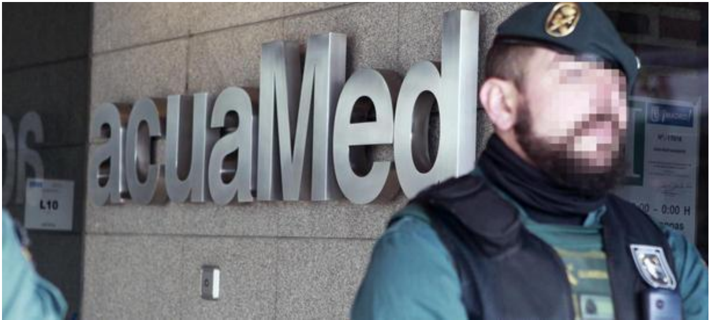
La Guardia Civil durante el registro en Acuamed el 18 de enero de 2016. VÍCTOR LERENA

La sección cuarta de la sala de lo Penal rechaza los últimos recursos contra el auto de procesamiento dictado en abril. Entre las obras investigadas hay cuatro en València, la Safor y Alicante, además de actuaciones en Algeciras, Tarragona y Murcia.