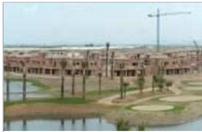
URBANIZACIÓN. Detalle de una urbanización turística en fase de construcción, con un campo de golf anexo.

Aunque los habitantes de la provincia de Alicante no son de los que más agua gastan en España en sus tareas domésticas, el caudal que podría ahorrarse es mucho mayor de no ser por el nuevo concepto de diseño arquitectónico de las viviendas que se construyen en la Costa Blanca. Tanto si son viviendas en propiedad horizontal como si se trata de casas pareadas o bungalós, la cuestión reside en construir en zonas interiores los dos cuartos de baño (es el número más común en los pisos de tres habitaciones de noventa metros cuadrados, el producto más consumido).