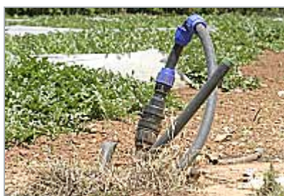
Medida tomada por los agricultores para poder regar a goteo.

También se pide a los agricultores que realicen técnicas de manejo del suelo que permiten