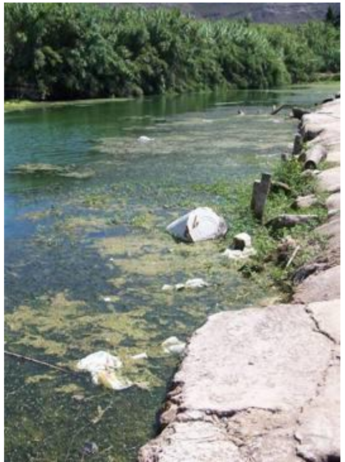
Un informe de las Cortes avala la peor toma del trasvase del Júcar para la provincia de Alicante

La conclusión del trabajo también contradice los estudios y analíticas realizados a lo largo de la última década que han puesto en evidencia que la mala calidad del agua en la toma del Azud de la Marquesa impide su uso para el riego generalizado (solo sirve para algunos cultivos leñosos) y para el consumo humano.