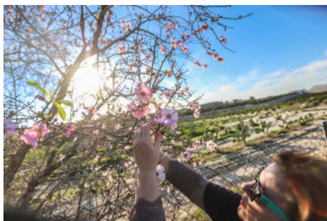
El primer almendro en flor