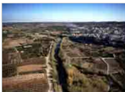
MRW - Fotografía Aérea. Río Turia, RIBARROJA.

El concejal calificó algunas de las cláusulas que figuran en la propuesta de convenio como "infumables. No se puede decir que la inversión realizada sea de 110 millones de euros, dado que el 40% es del presupuesto del Estado, otro 40% de instituciones financieras y el 20% restante de fondos de cohesión. Los valencianos