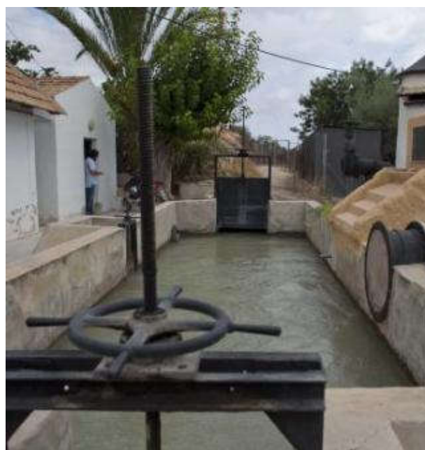
El Congreso cancela el «tasazo» del Tajo

Las medidas aprobadas ayer supondrán exenciones a los regantes en los pagos por el cánon de regadío, moratoria en el abono de las cuotas a la Seguridad Social y, entre otras, la condonación este año del «tasazo», por valor de 12 millones de euros, que el Ministerio de Agricultura quería cobrar a los agricultores por el mantenimiento de la infraestructura del trasvase Tajo-Segura pese a que por la canalización no circula agua desde el mes de mayo.