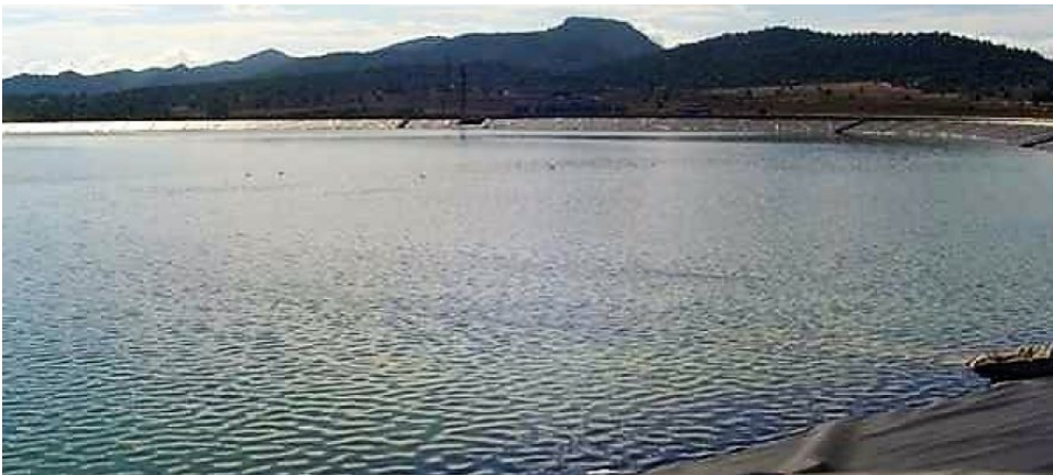
Embalse del Toscar de Monóvar