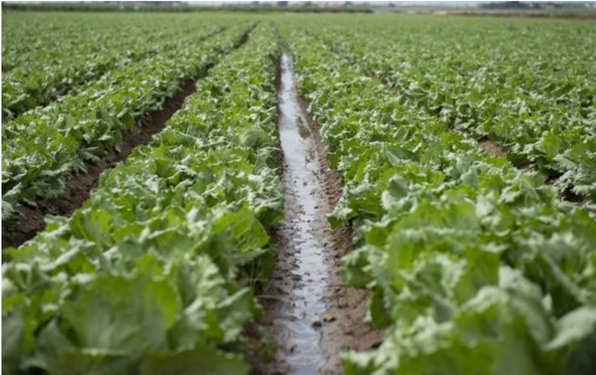
Terrenos de cultivo en el Campo de Cartagena.

EE UU decide hoy si impone mayores tasas a productos europeos como el vino y el aceite, un «golpe insalvable» para el sector