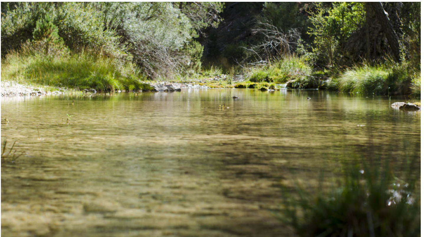
El Tajo Dorado, en el tramo del río que forma el Parque Natural del Alto Tajo.