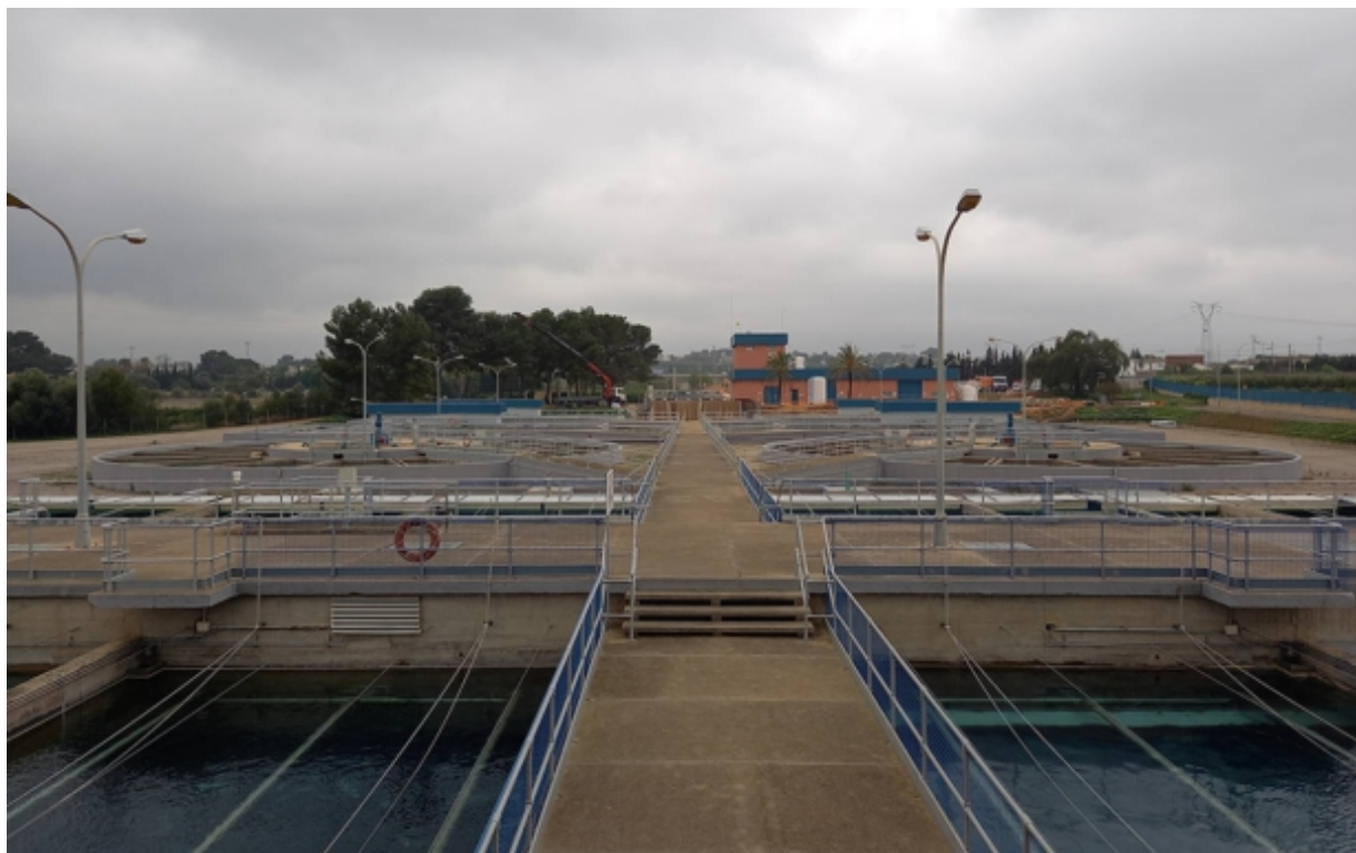
Las instalaciones de una de las depuradoras de la Emshi.

El proyecto contempla una inversión cercana a los 260 millones de euros para dar más garantías al servicio de abastecimiento de agua potable