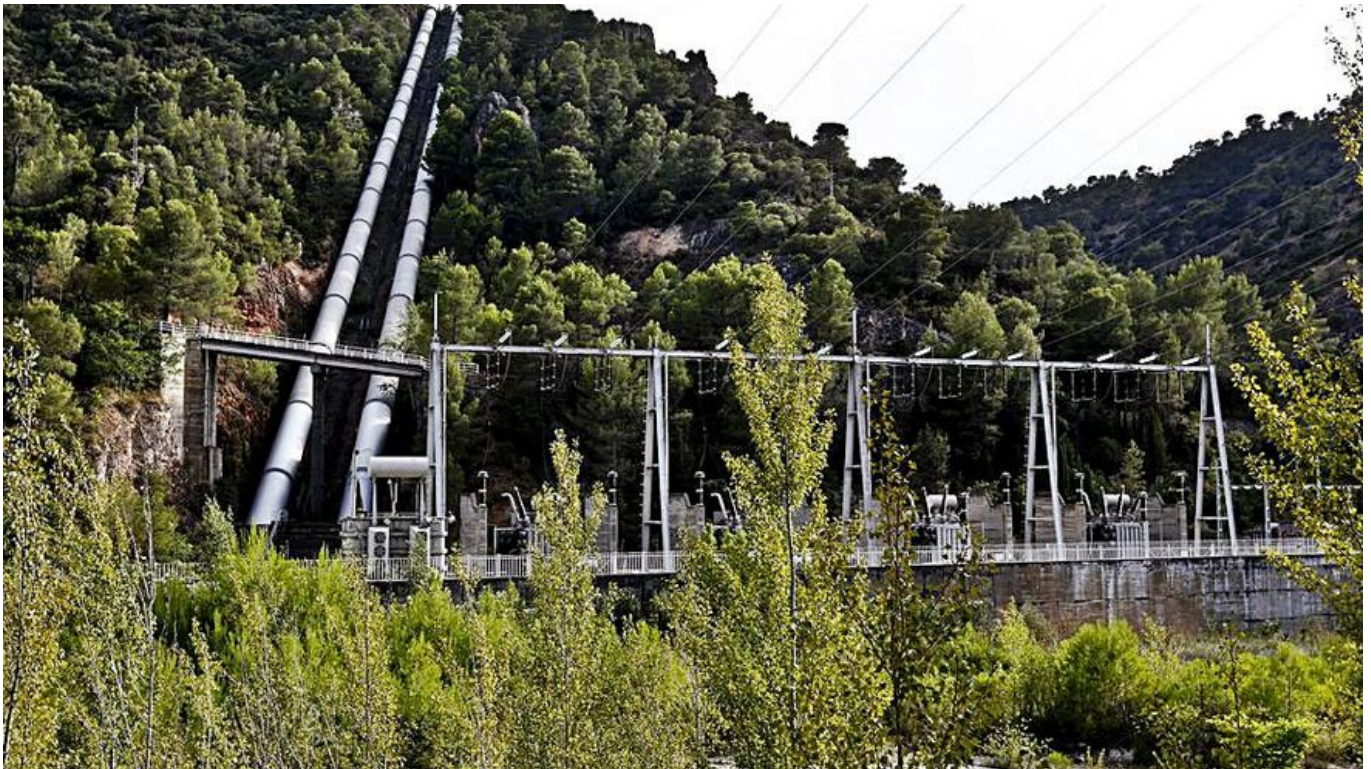
Embalse de Bolarque, puerta de arranque del trasvase.

La reducción del caudal aprobada esta semana ha llevado a que el Sindicato Central de Regantes del Acueducto Tajo-Segura haya convocado para este lunes una reunión del Círculo por el Agua, en el que están representados empresarios de Alicante y Murcia. En encuentro tendrá lugar en la capital murciana con el objetivo de abordar «acciones a llevar a cabo ante la propuesta del Ministerio para la Transición Ecológica y el Reto Demográfico de rebajar los volúmenes del trasvase mediante reales decretos».