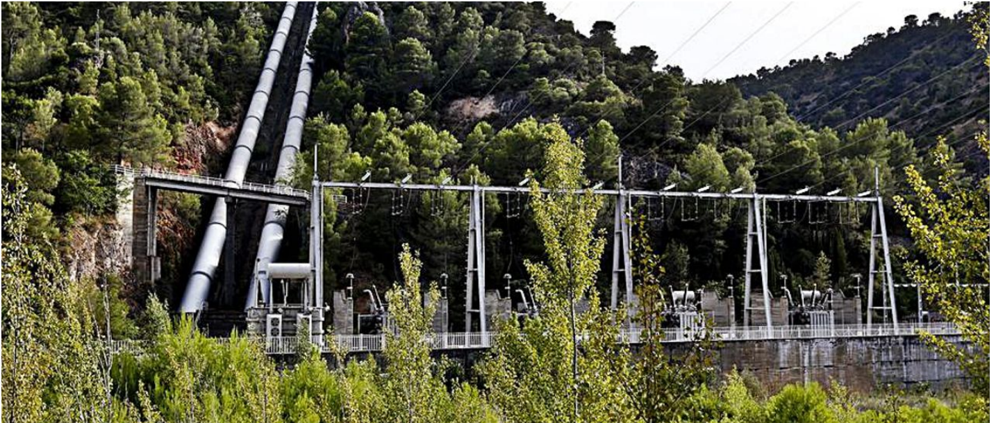
Embalse de Bolarque, puerta de arranque del trasvase.