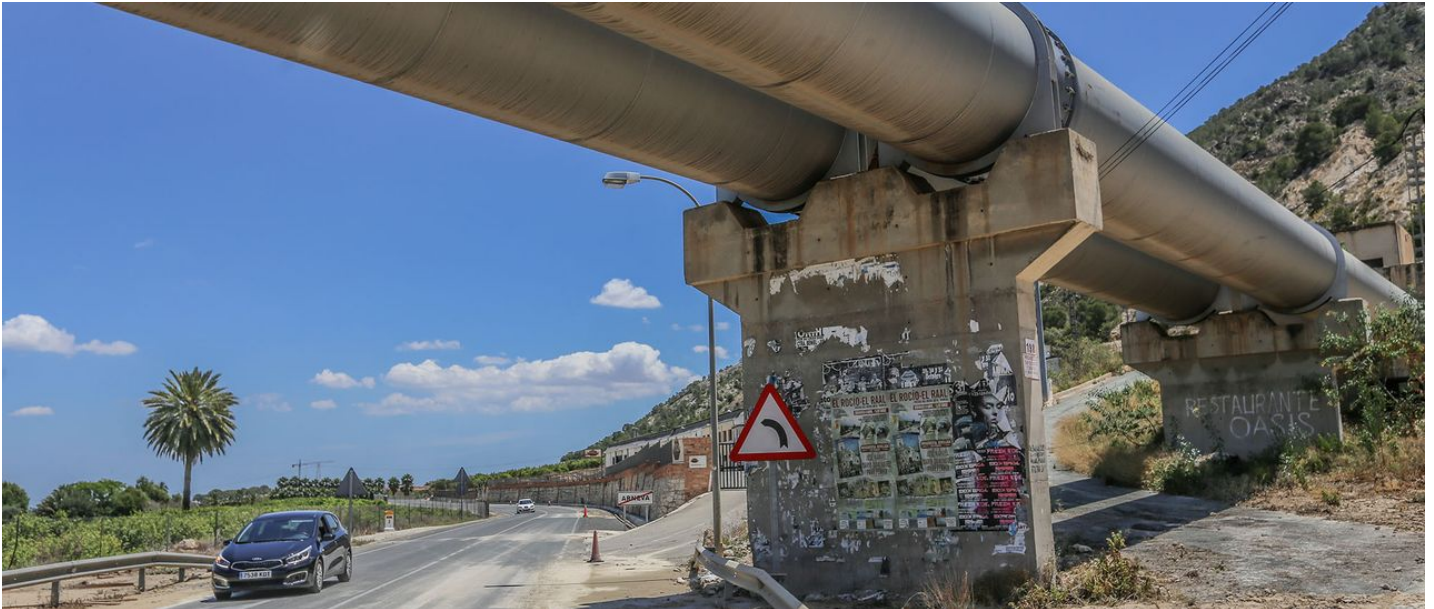
Conducciones del trasvase Tajo-Segura en la Vega Baja TONY SEVILLA