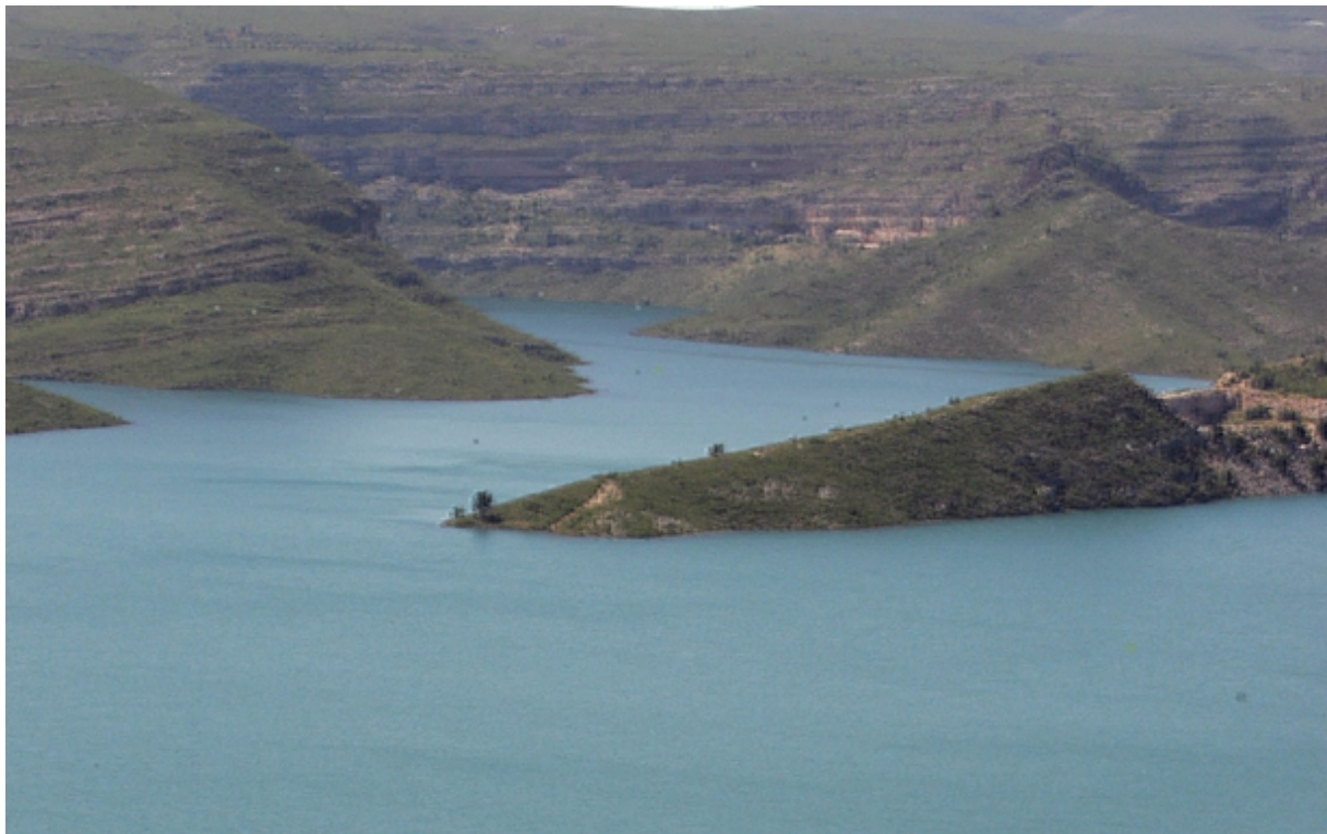
Embalse de Tous.

El buen año hidrológico permite atender las demandas de los usuarios y los caudales ecológicos