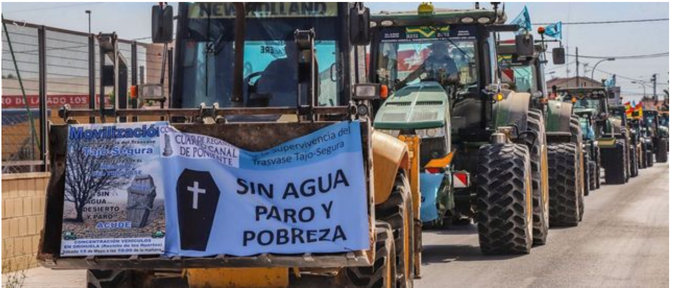
Un momento de la tractorada -600 vehículos- que recorrió la Vega Baja y Elche el sábado.