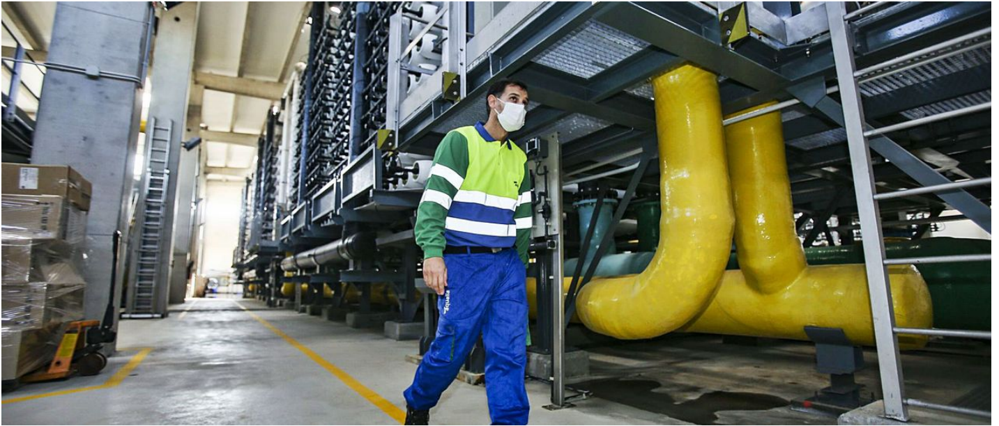
La planta desalinizadora de Mutxamel-El Campello, en una imagen del pasado año.