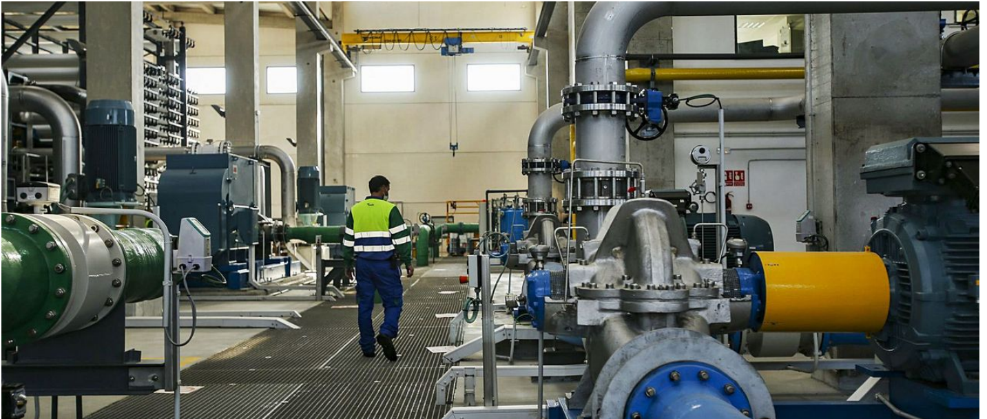
La planta desaladora de Mutxamel-El Campello.