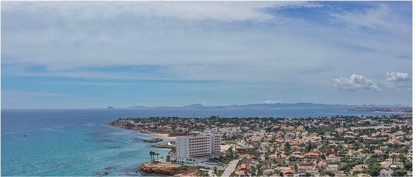
Urbanizaciones en la costa de Orihuela, paradigma del turismo residencial.