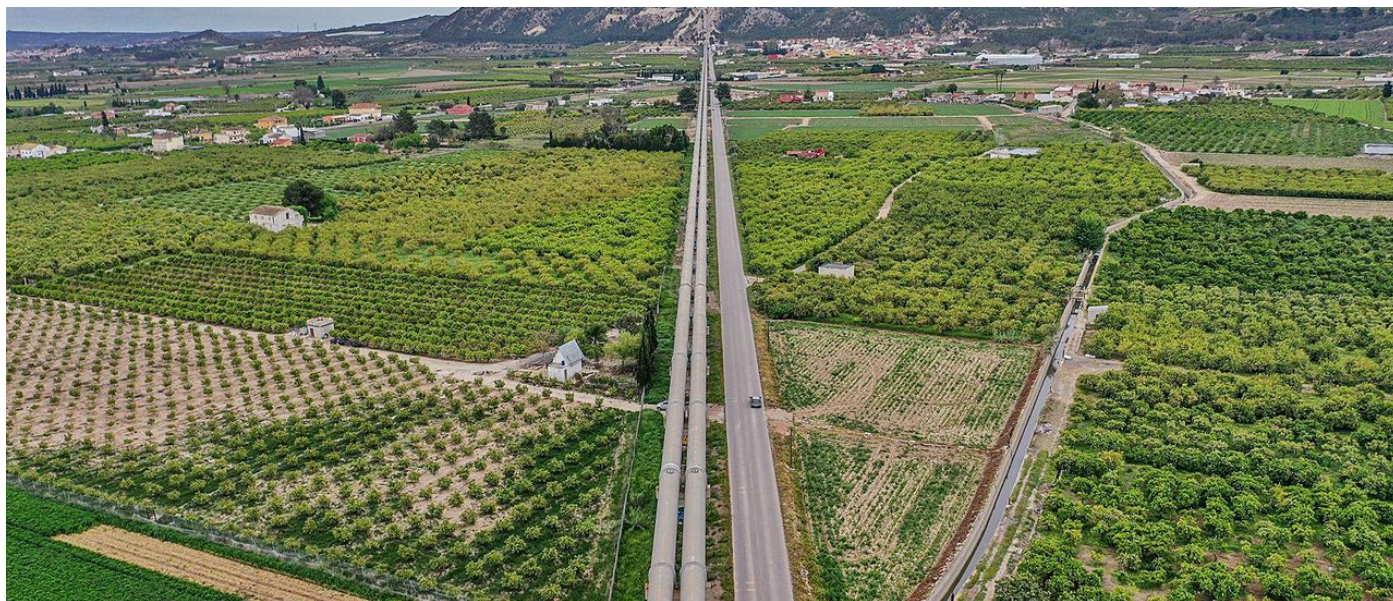
Imagen aérea de los tubos del postravase a su paso por la huerta de Orihuela.