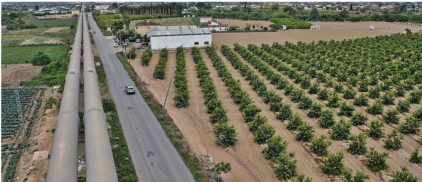
Tuberías del trasvase Tajo-Segura a su paso por el municipio de Orihuela, en la comarca de la Vega Baja.