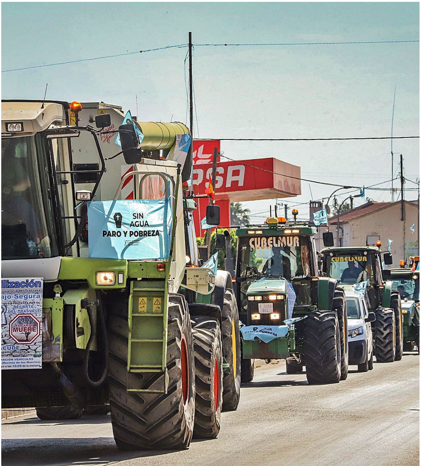
Las movilizaciones de los agricultores no han servido.

Esta medida supondrá, en base la estadística del comportamiento de la reserva del agua en la cabecera del río, un recorte anual de entre 13 hm 3 y 60 hm 3 que son, estos últimos, los hectómetros cúbicos de agua que no hubieran venido en el último año, en el que durante cinco meses consecutivos el Ministerio para la Transición Ecológica ha trasvasado el caudal máximo mensual hasta este mismo mes de julio. Los técnicos ya han advertido, en este sentido, de que a partir de agosto la situación del trasvase volverá a nivel 3, por lo que según las reglas de explotación actuales y futuras -este aspecto no cambia-, el trasvase mensual será de hasta 20 hm 3 previo informe y según determine la vicepresidenta Ribera.