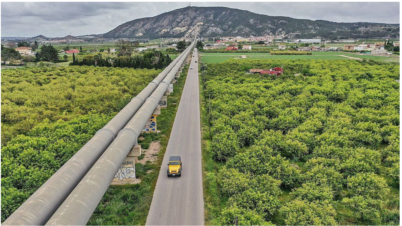
Rechazo frontal a la decisión del Gobierno de recortar el Tajo-Segura

Más contundente, aún si cabe, es la opinión que los encuestados que dijeron conocer la decisión del Gobierno de Pedro Sánchez de recortar la infraestructura tienen sobre la posición que ha mantenido el Consell ante el Ejecutivo central. Un 76,4% considera que la Generalitat, con el socialista Ximo Puig al frente, ha mantenido una actitud de debilidad ante Sánchez y la ministra Teresa Ribera. De poco le ha servido al presidente de la Generalitat repetir hasta la saciedad que el trasvase «es irrenunciable» y que el Consell ha acudido 38 veces a los tribunales para defenderlo, ya que los ciudadanos consideran que ante quien debía tener una posición firme no lo ha hecho. Poco más del 22% son los que opinan que su postura ha sido firme en este asunto y el 1% que es muy firme.