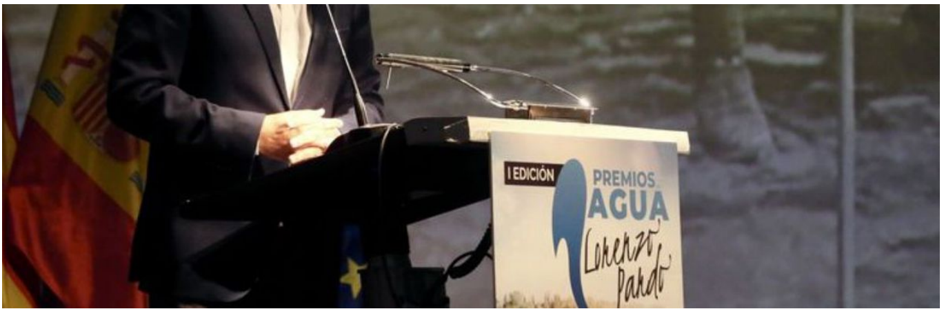
Carlos Mazón, presidente de la Diputación de Alicante, clausuró la gala.

Asimismo, el presidente de la Diputación añadió que detrás de estos galardones «hay un concepto de agua y de España que pone de manifiesto que en nuestro país hay agua para todos si se administra correctamente, como demostró Lorenzo Pardo». En este sentido, Mazón volvió a criticar los continuos recortes al trasvase y recordó que la alternativa de la desalación que propone el Gobierno de España «no vale porque, entre otras cosas, cuadruplica el coste energético. En estos momentos, con el precio de la luz como está, se vuelve a demostrar que la desalación no es que sea gravosa, sino que sería verdaderamente un cuchillazo para los intereses definitivos de los regantes y agricultores de la provincia », afirmó.