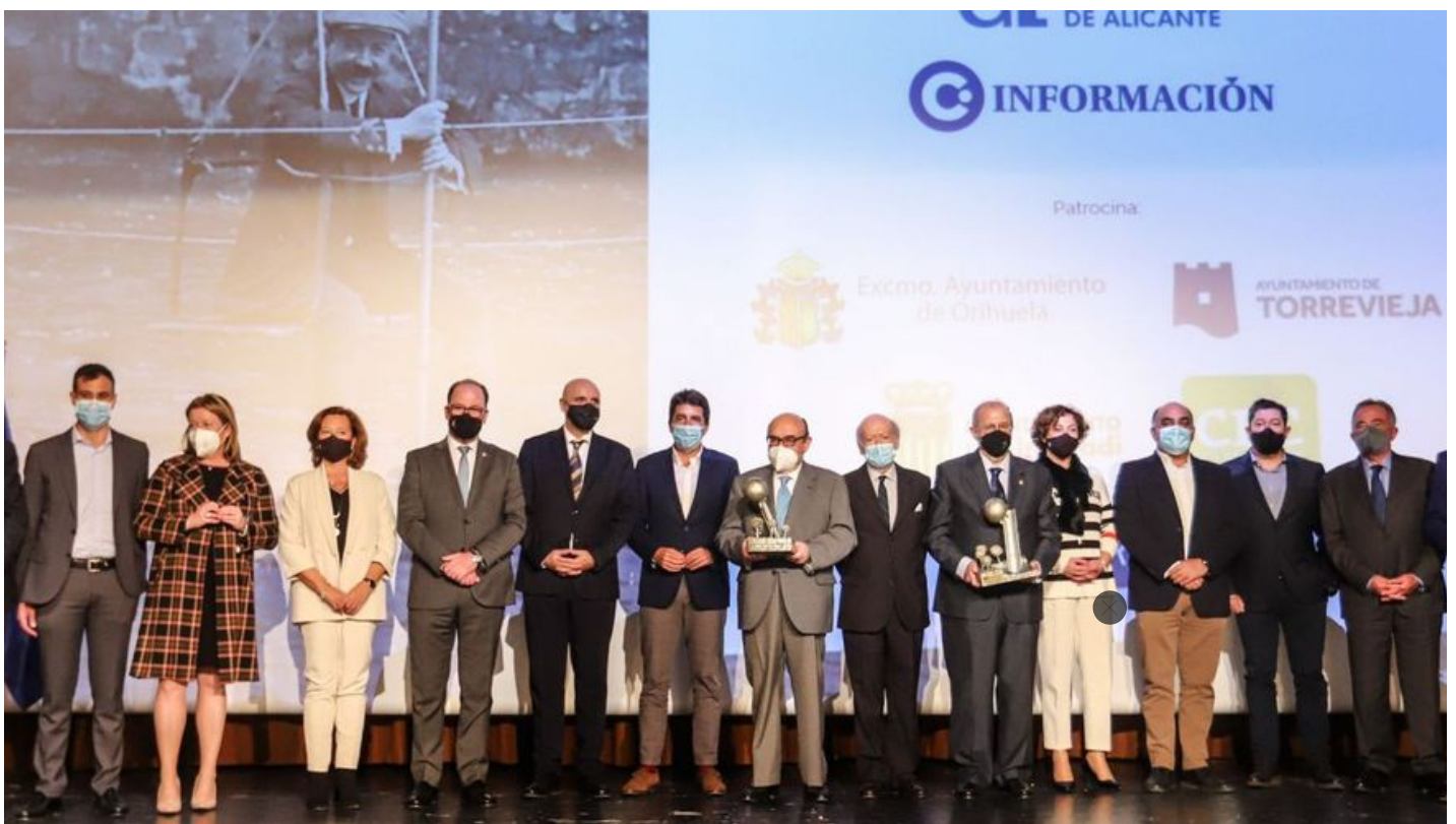
Imagen de las diversas autoridades junto con los galardonados en el acto celebrado ayer en la Fundación CAM de Orihuela.

12·11·21 | 00:15 | Actualizado a las 17:17