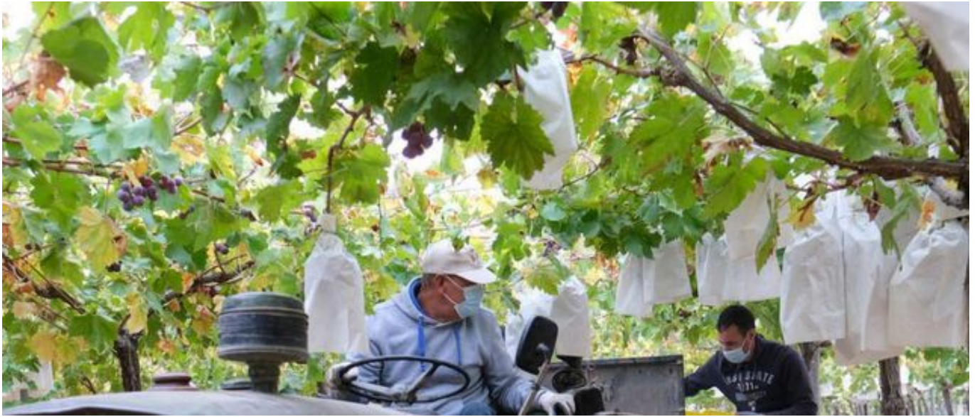
Agricultores recolectan uva de mesa en el Medio Vinalopó.