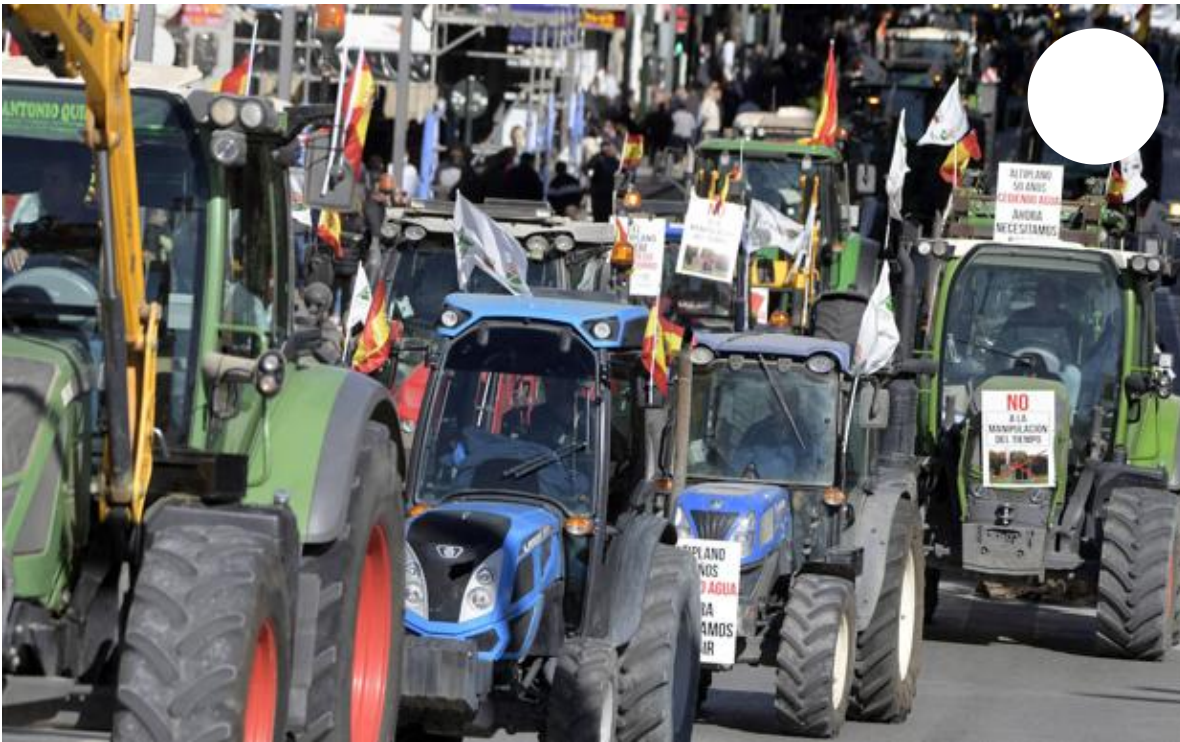
Galería. Tractores durante la marcha del campo, este miércoles.

La movilización comenzó de madrugada a lo largo y ancho de la Región, cuando las caravanas de tractores, camiones y autobuses iniciaron sus recorridos hacia Murcia, en cuatro columnas escoltadas por la Guardia Civil que utilizaron carreteras secundarias. La mayor parte de los vehículos se concentró en La Fica para incorporarse, a las 11 horas, a la manifestación, de forma ostensible y muy sonora.