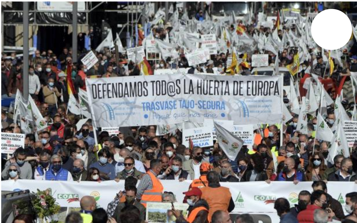
Galería. Manifestantes con pancartas durante la marcha de este miércoles.