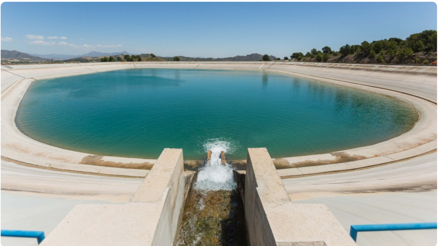
Embalse del trasvase del Júcar (archivo).

Compartir WhatsApp Twitter Facebook Enlace