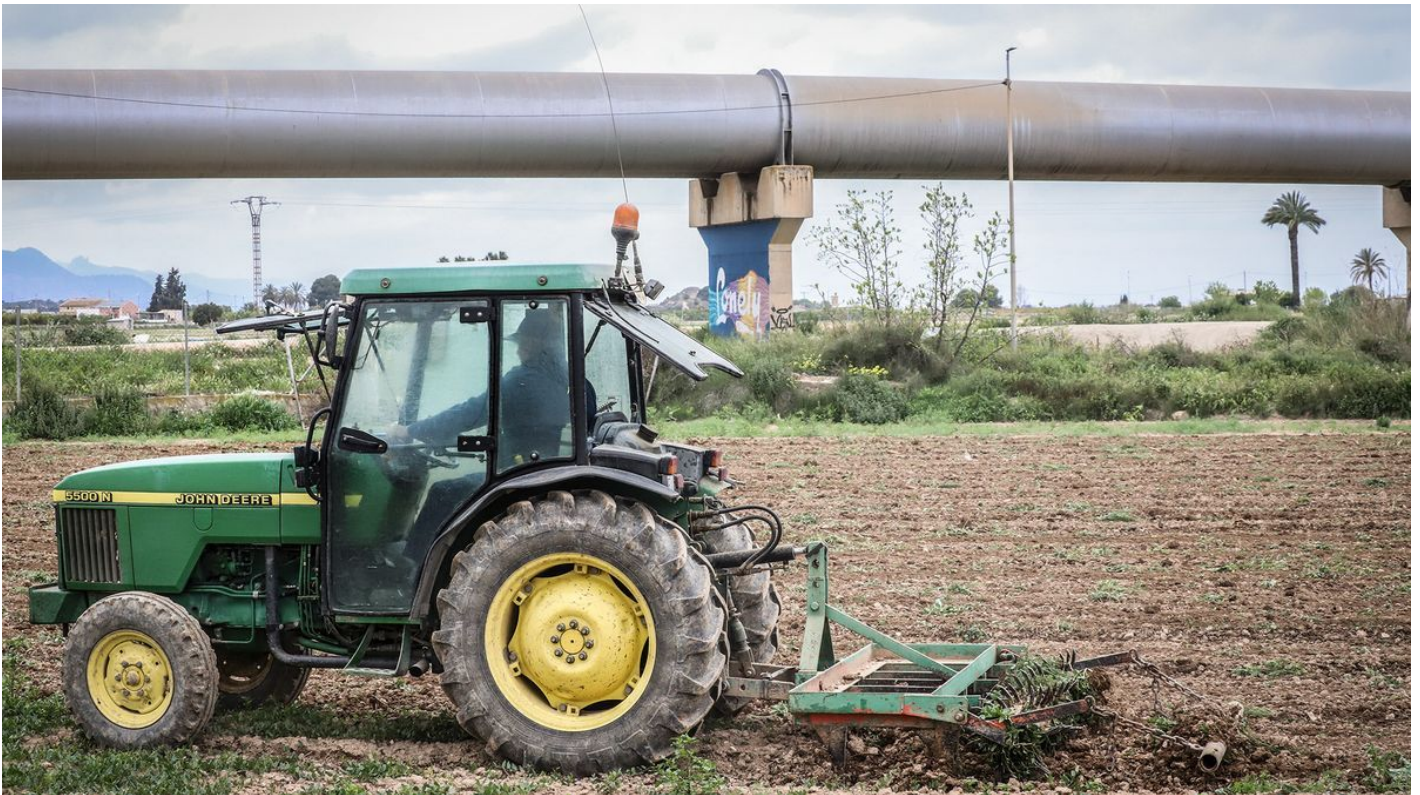
Un agricultor labrando el campo con su tractor junto a tuberías del trasvase TONY SEVILLA

El Sindicato Central de Regantes del Acueducto Tajo-Segura (SCRATS) ha lanzado la campaña “Agricultores de usar y tirar” , que busca visibilizar las diferentes trabas que el sector agrícola español sufre para realizar su trabajo. Este sector ha demostrado ser esencial durante décadas en nuestro país y con más importancia si cabe durante la pandemia. “Pero los profesionales del campo ahora han sido abandonados ante la ingente cantidad de problemas que les impide producir alimentos saludables con seguridad y dignidad. Tras pasar esos momentos de absoluta esencialidad, se han convertido en agricultores de usar y tirar” , manifiesta Lucas Jiménez, presidente del Scrats.