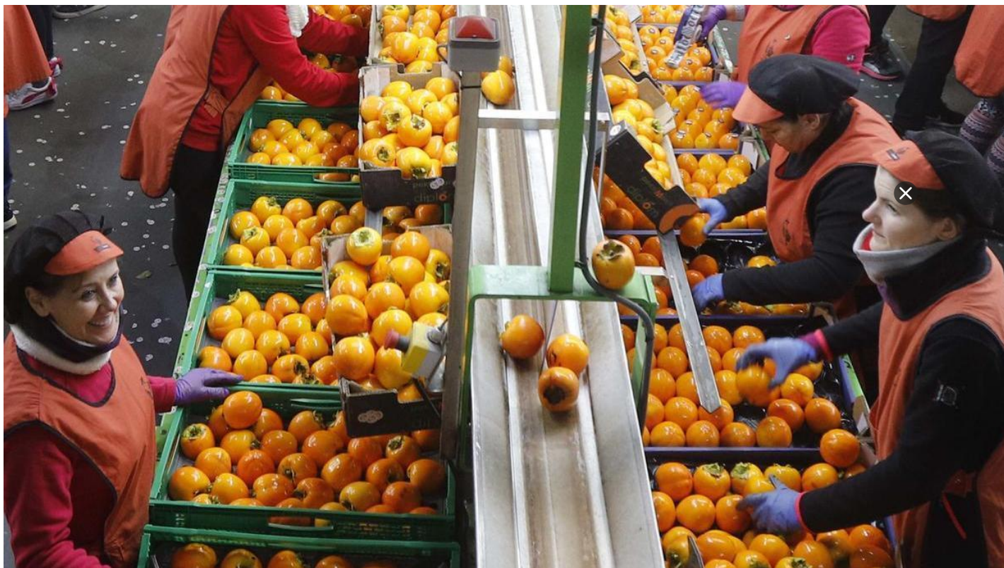
Envasado del caqui en la cooperativa de Carlet.

La campaña del caqui ha sido tan corta debido al extraordinario recorte de la producción debido al frío y las lluvias que se registraron durante la primavera, que en algunos mercados como Canadá o Emiratos Árabes no ha podido abastecerse de esa fruta tan identificativa de la Ribera . Por su parte, la actual campaña citrícola, que comienza su segunda parte, ha registrado una menor oferta por la merma del 25-30 % en la producción, superior a la inicialmente estimada, que ha resultado con mejores precios para el agricultor.