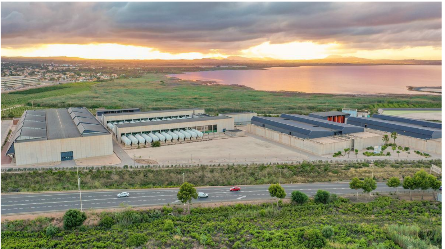
Imagen aérea de la desaladora de Torrevieja.

22·02·23 | 18:41 | Actualizado a las 20:09