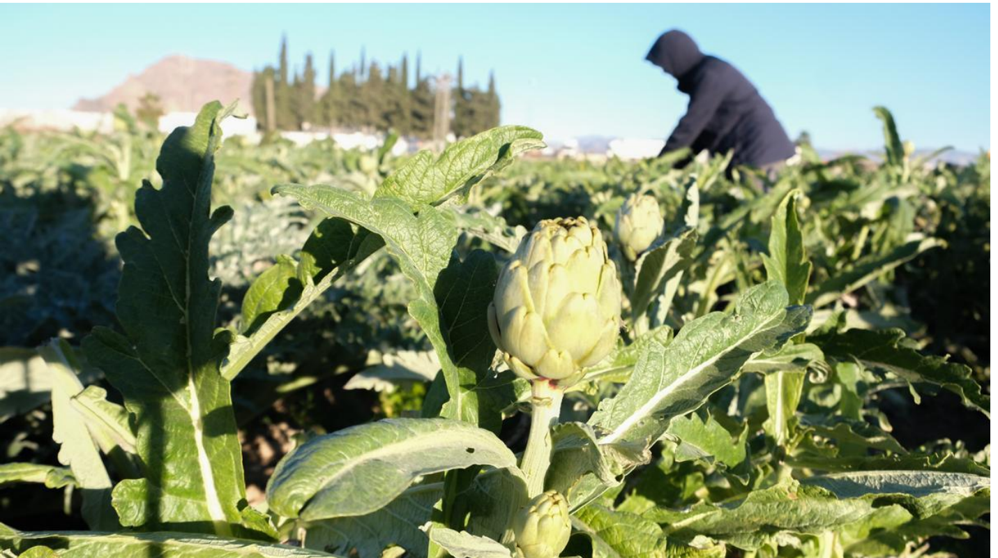
Recolección de hortalizas en la Vega Baja, uno de los productos que más se ha encarecido. AXEL ALVAREZ

15·03·23 | 06:00 | Actualizado a las 06:00