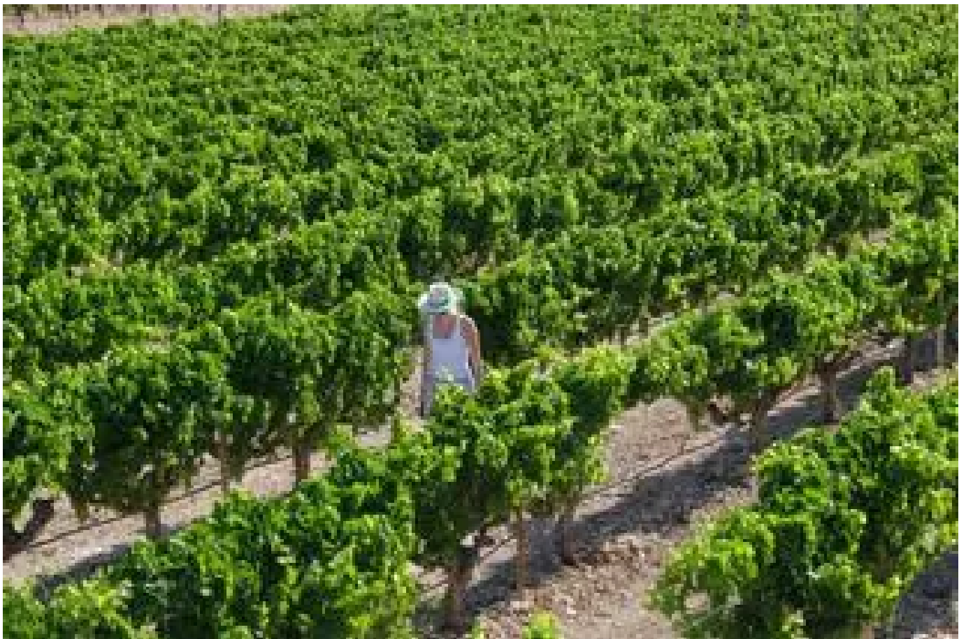
Plantación de uva de mesa en la comarca del Medio Vinalopó.

Así mismo, el Ayuntamiento señala que "el proyecto descarta el soterramiento sin aportar una justificación suficiente". Además, recuerda que "el Catálogo de Protección , sección Paisaje, cuya aprobación inicial se produjo en marzo de este año en el pleno municipal, establece la prohibición de utilizar líneas aéreas en el término municipal".