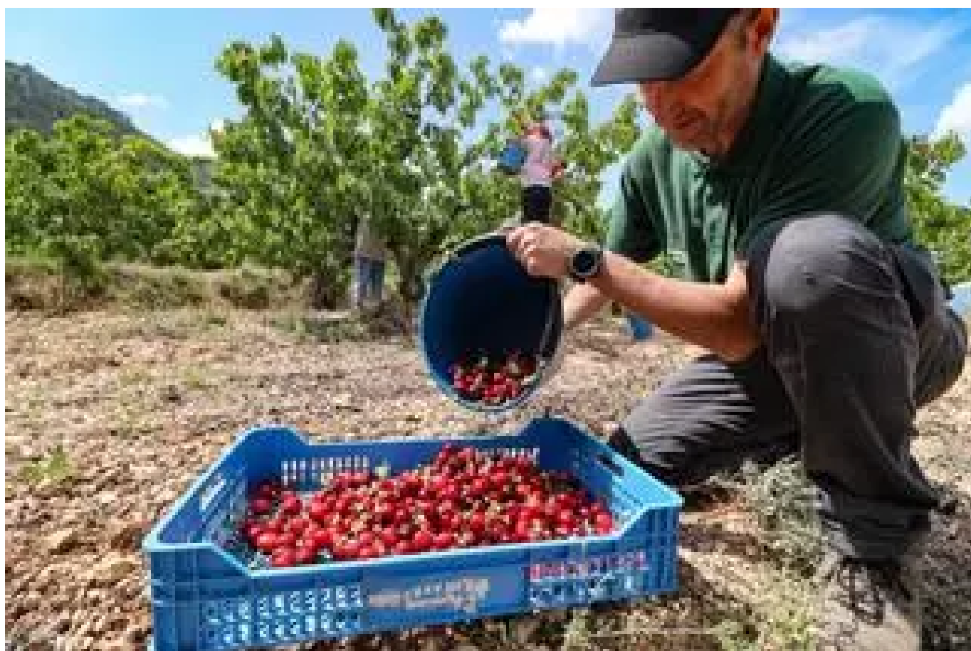
Recolección de cerezas en Planes, municipio de El Comtat.

Fue en mayo del año pasado cuando el ministro de Agricultura, Pesca y Alimentación, Luis Planas, y la ministra de la Administración General de Aduanas de China, Sun Meijun, firmaban un protocolo para exportar cerezas al país asiático, en el marco de un viaje oficial del presidente del Gobierno, Pedro Sánchez. El acuerdo se formalizaba en un contexto en el que el país asiático buscaba proveedores alternativos a los de EE UU , en medio de la guerra arancelaria promovida por el presidente norteamericano Donald Trump.