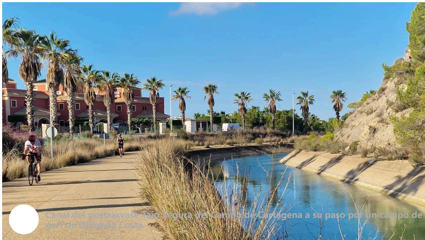
Canal del postrasvase Tajo Segura del Campo de Cartagena a su paso por un campo de golf de Orihuela Costa

El Scrats admite que el resultado de esta nueva iniciativa a través de un incidente de nulidad será «muy posiblemente negativo», pero sostienen que el fallo no ha ido al fondo del recurso que avala el gran impacto económico de la decisión