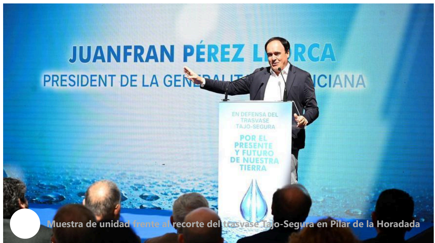
Muestra de unidad frente al recorte del trasvase Tajo-Segura en Pilar de la Horadada

El presidente del Sindicato Central, que agrupa a 80.000 regantes y empresas agrícolas y más de sesenta comunidades de riego, cuestiona además el fondo ambiental de la decisión. Afirmar que «la salud del río» Tajo, que es la que se pretendía preservar, no preocupaba a quienes la adoptaron y que tampoco se tuvo en cuenta el futuro de las regiones dependientes del trasvase que aporta caudales a Alicante, la Región de Murcia y Almería.